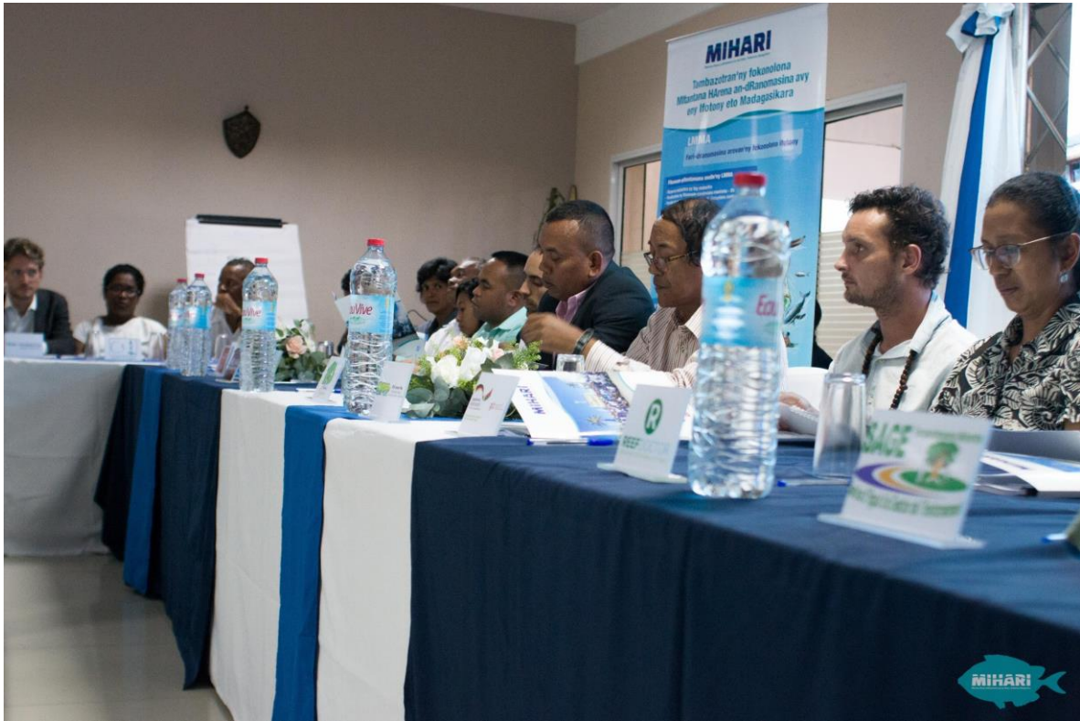
Figure 1 : Aperçu sur une partie des signataires/représentants des organisations membres